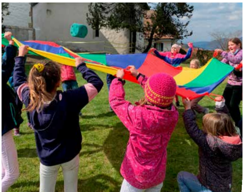
Einfach nur Spielfreude!