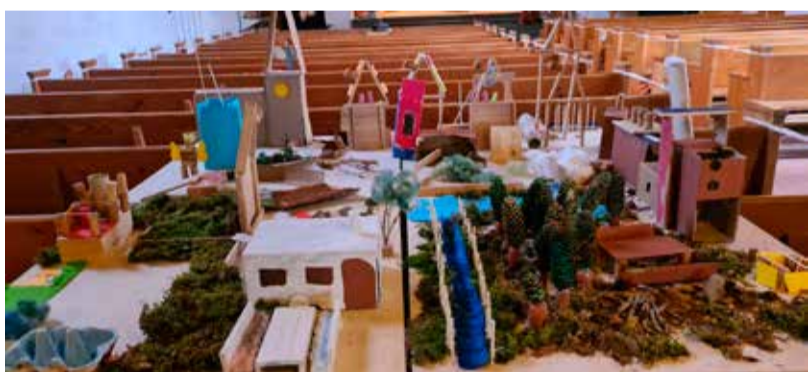
Zwar oft etwas verborgen, aber doch gegenwärtig, begleiten uns Gottes gute Boten, seine Engel. Finden Sie sie?

KINDERWOCHE An vier Nachmittagen in den Frühlingsferien fand die Kinderwoche zum Thema «Von Engeln umgeben» statt.